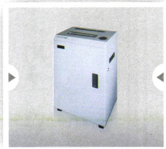
HYX-Z102碎纸机·专业碎纸 一级资质

可销毁硬盘、硒鼓、光盘、U盘、IC卡、SD卡/CF卡/TF(MicroSD)卡/MMC卡/MiniSD卡等存储介质。