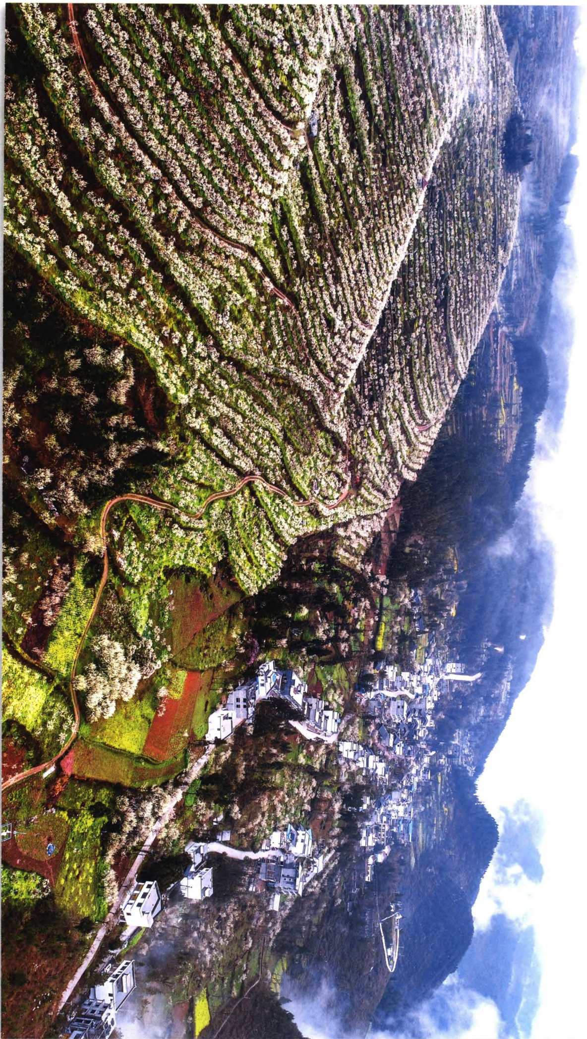
沙子十二盘空心李花——贵州沿河