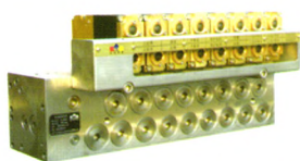
SAC型液压支架电液控制系统