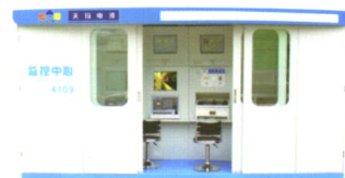
SAM型综采自动化控制系统