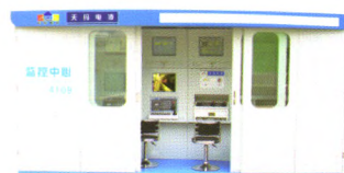
SAM型综采自动化控制系统