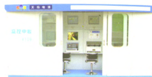
SAM型综采自动化控制系统