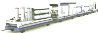
SAP型智能集成供液系统