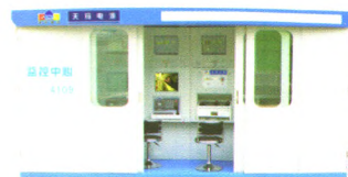
SAM型综采自动化控制系统