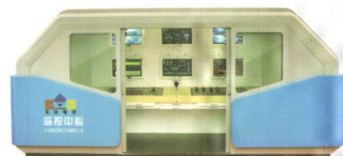
SAM型综采自动化控制系统