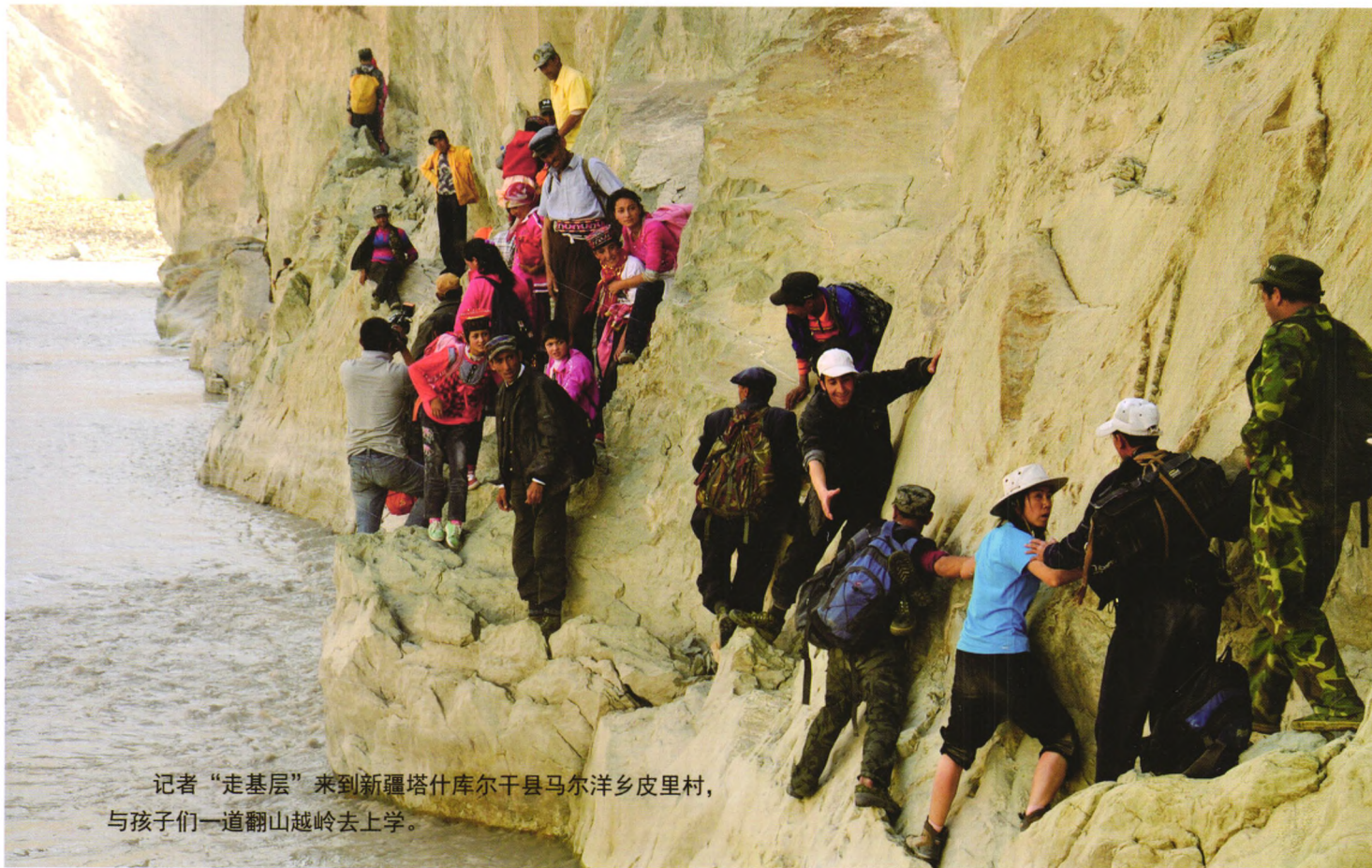
记者“走基层”来到新疆塔什库尔干县马尔洋乡皮里村，与孩子们一道翻山越岭去上学。