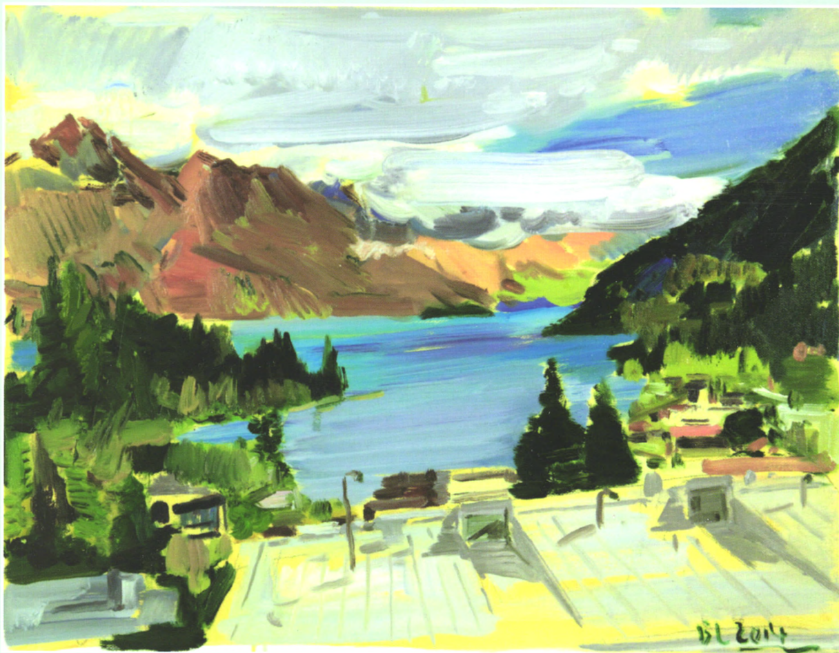
瓦卡蒂普湖之一 (油画 50cmx65cm)