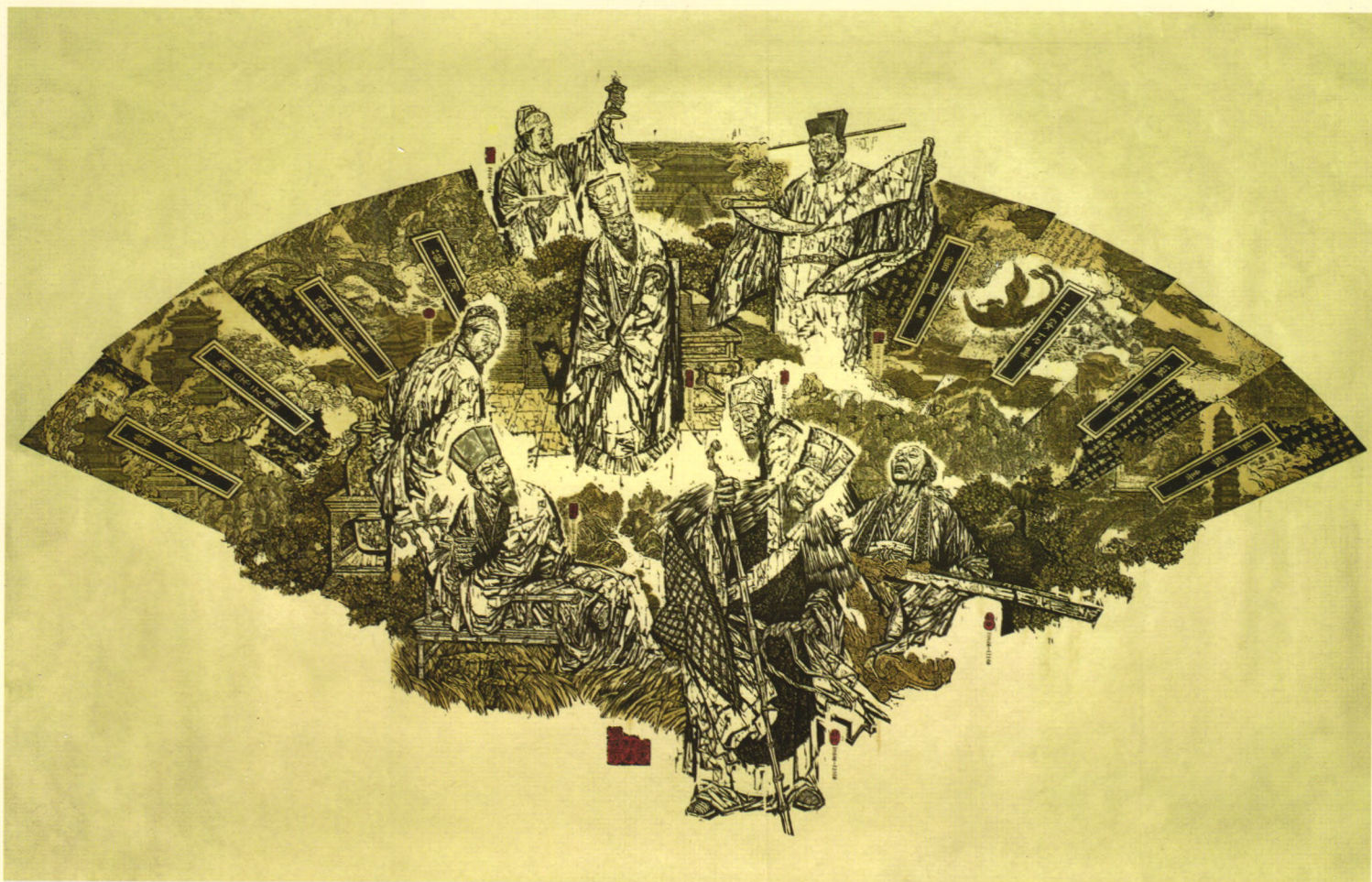
中华文明历史题材美术创作工程《唐宋八大家》 版画