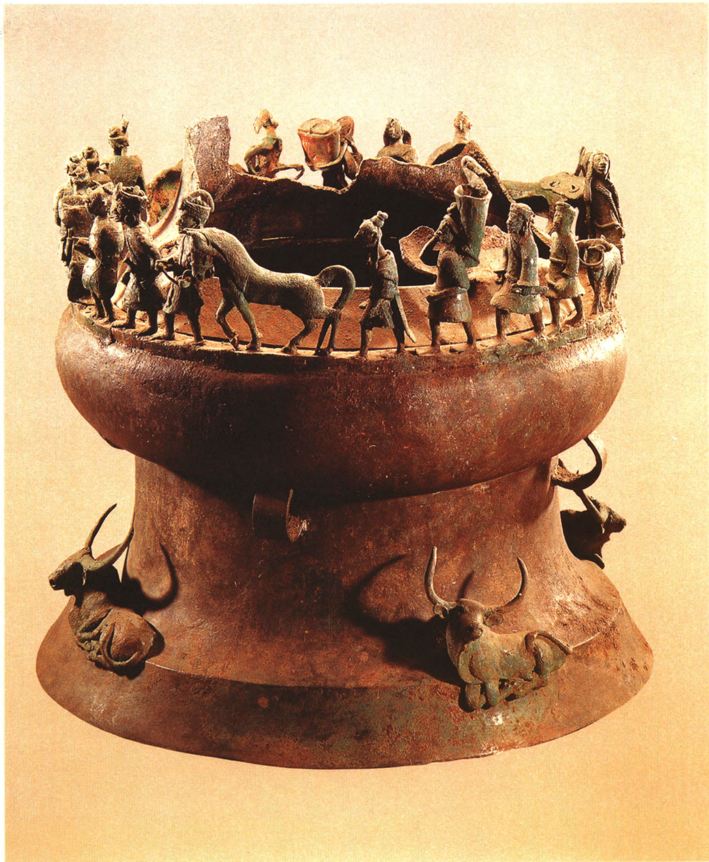
《贡纳场面贮贝器》 青铜器