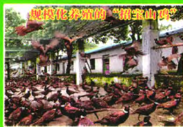
超规模化养殖的“招宝山鸡”