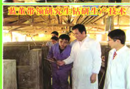
总农事研发野生动物驯养技术