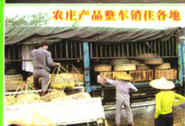
农庄产品整车销往各地