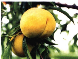
精品晚熟黄桃—黄香蜜

在绿康5月18日左右成熟，平均单果重130克左右，特大果重180克，从果形看，果形圆整，但是，金黄色，桃有较好的发展前景。