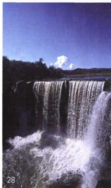
封一:竞飞