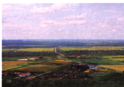
封一:丰收曲