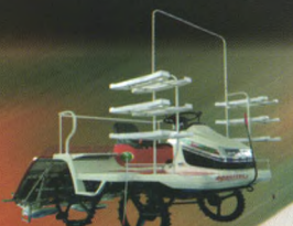
东风农机牌2ZG-6A型插秧机