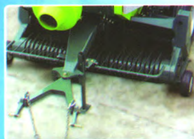
带有2p急转弯装置， 实现小角度的转弯