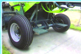
人性化的脚踏板设计， 便于机器的调节与维修