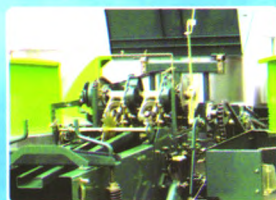
可靠的STAR原装进口打结器