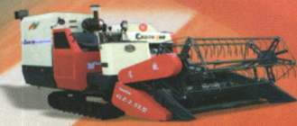
常拖牌4LZ-2.5Z型全喂入收割机