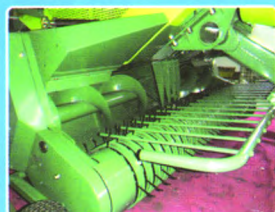
具有高效、宽幅的捡拾机构