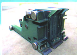
经久耐用的活塞防尘轴承滚筒