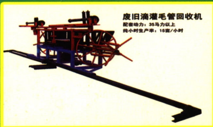
废旧滴灌毛管回收机 配套动力：35马力以上 纯小时生产率：18亩/小时