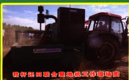
秸秆还田联合整地机工作现场图