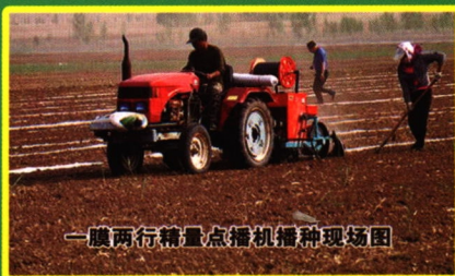
一膜两行精量点播机播种现场图