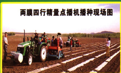
两膜四行精量点播机播种现场图