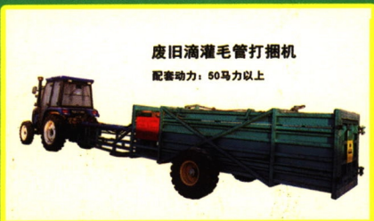
废旧滴灌毛管打捆机 配套动力：50马力以上