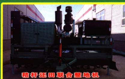
秸秆还田联合整地机