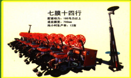
七膜十四行 配套动力：180马力以上 总成膜宽：700mm 纯小时生产率：12亩