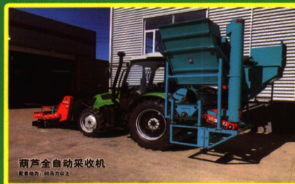
葫芦全自动采收机 配套动力：80马力以上