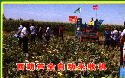
西葫芦全自动采收机