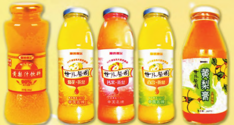
“世外梨园”高档系列