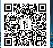
牛栏山酒厂微信公众平台