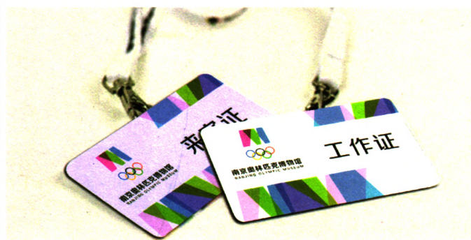
1 “南京奥林匹克博物馆” Logo及视觉形象系统 2014年