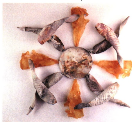
「周而复始」陶瓷与玻璃艺术 孙睿 指导教师 李雨花