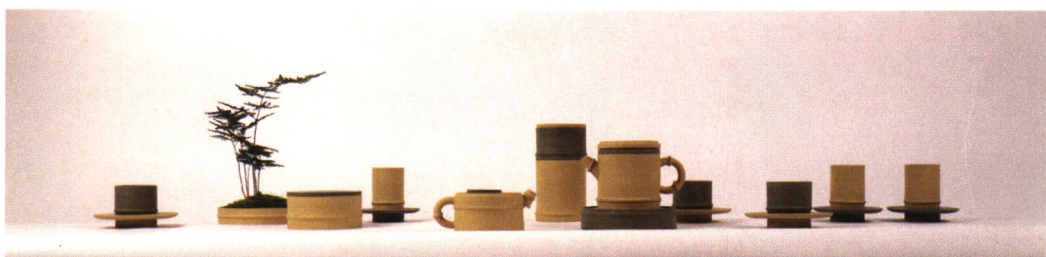
「竹林里」陶瓷与玻璃艺术 陈蒙泰 指导教师 陆斌