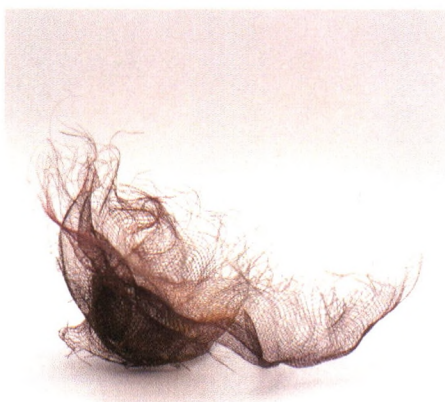
「扭转张力系列」漆器艺术 朱曼磊 指导教师 周军南