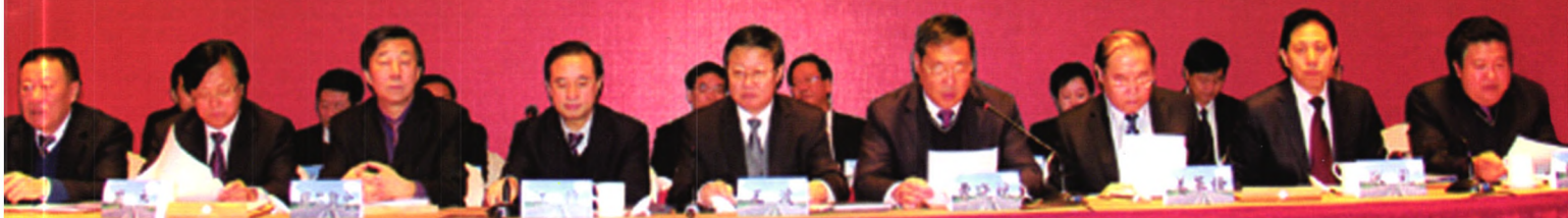
内蒙古自治区交通运输工作会议暨廉政工作会议于2013年1月21日在呼和浩特召开