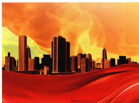
27 关于进一步加强民主党派参政议政能力建设的思考