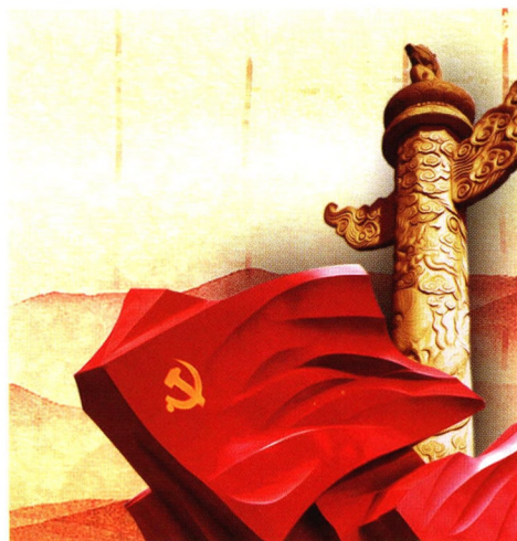
31 建国前后中国共产党在多党合作中的领导艺术