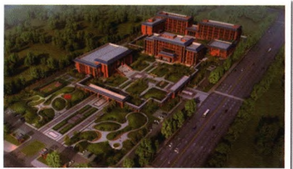
内蒙古社会主义学院新校区规划图