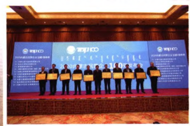
与100强企业代表合影

12月12日，2020内蒙古民营企业100强发布会暨民营经济创新发展大讲堂在呼和浩特召开。自治区党委常委、统战部部长段志强出席会议并讲话。