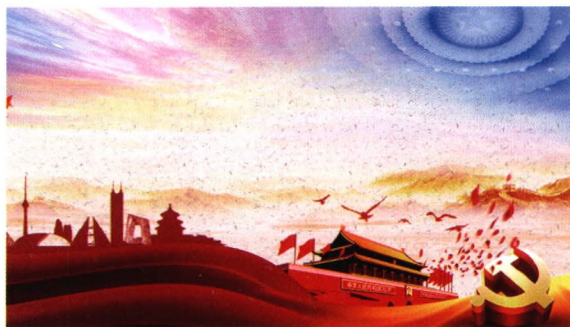
11 铸牢中华民族共同体意识