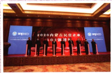
2020内蒙古民营企业100强发布会暨民营经济创新发展大讲堂在呼和浩特召开