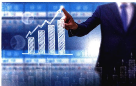
43 切实加强新时代民营经济统战工作