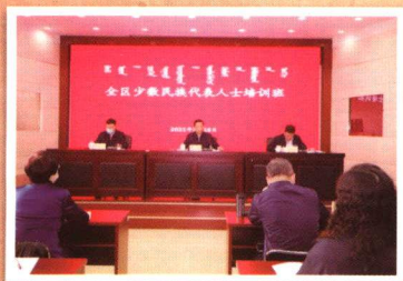
自治区党委常委、统战部部长、自治区政协党组副书记段志强出席开班式并讲话