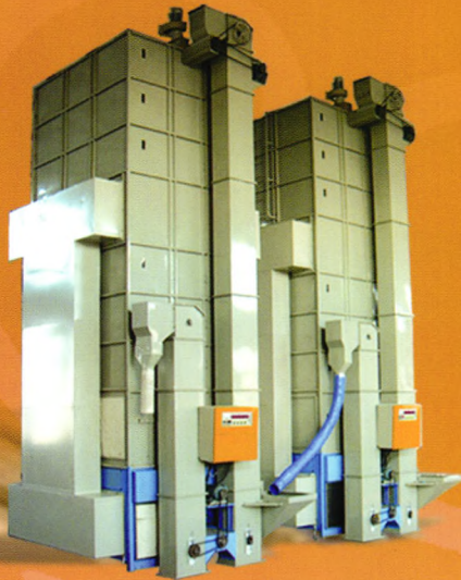
连续式干燥机机组