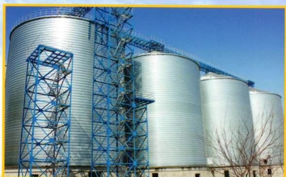
九三油脂集团铁岭公司

山东迎春总部位于黄河入海口的东营市,1978年引进美国钢板仓的生产技术,是中国最早制造钢板仓的厂家,现在可为用户提供单仓容量5T-16000T各种类型钢板仓,各种粮物流送设备和工程等。