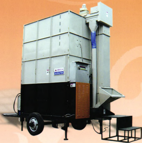
移动式循环干燥机