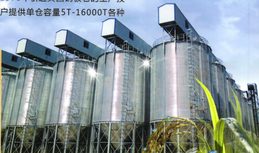
新疆奥瑞种子公司