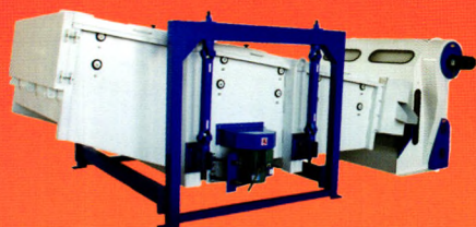
TXZS系列旋振筛(与循环风选器配套)