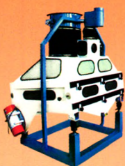
TQSF系列重力分级去石机