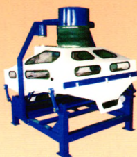
TQXQ系列吸式比重清选机