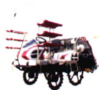
洋马乘坐式高速插秧机YR60DZF

地址：江苏省无锡市新吴区黄山路8号 电话：0510-85216887 (销售) 85221448 (部品) 400-808-9882 (服务) http://www.yanmar-china.com/cn/