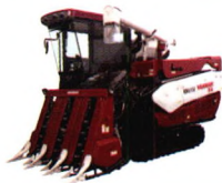
洋马半喂入联合收割机YH6118