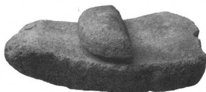
红山文化遗址出土的石磨