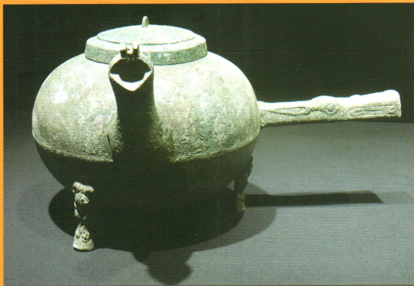
南昌汉海昏侯墓出土的铜盃