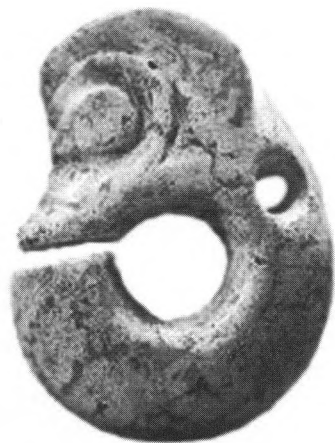
红山文化遗址出土的中国最早的玉龙