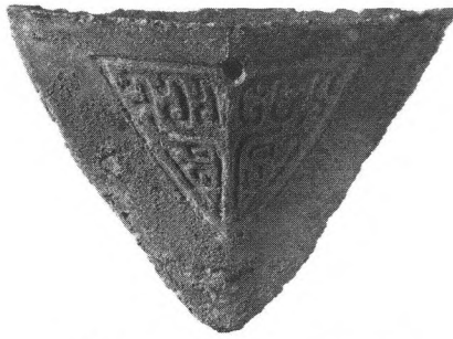
新干大洋洲商墓出土的青铜犁铧