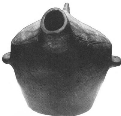
田螺山遗址出土的龟形陶盃