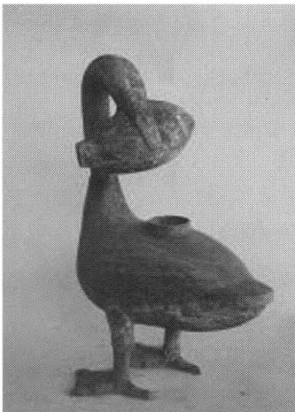
汉海昏侯墓出土的青铜雁鱼灯