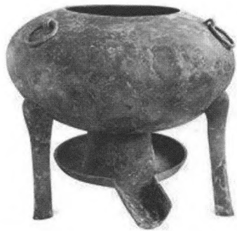
汉海昏侯墓出土的青铜温鼎