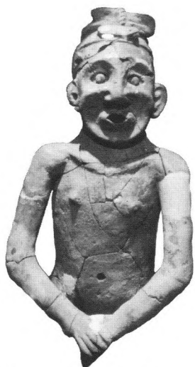
红山文化遗址出土的中国最早陶人