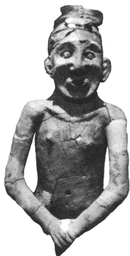
红山文化遗址出土的中国最早陶人