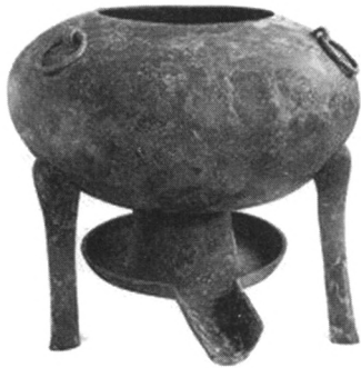
汉海昏侯墓出土的青铜温鼎