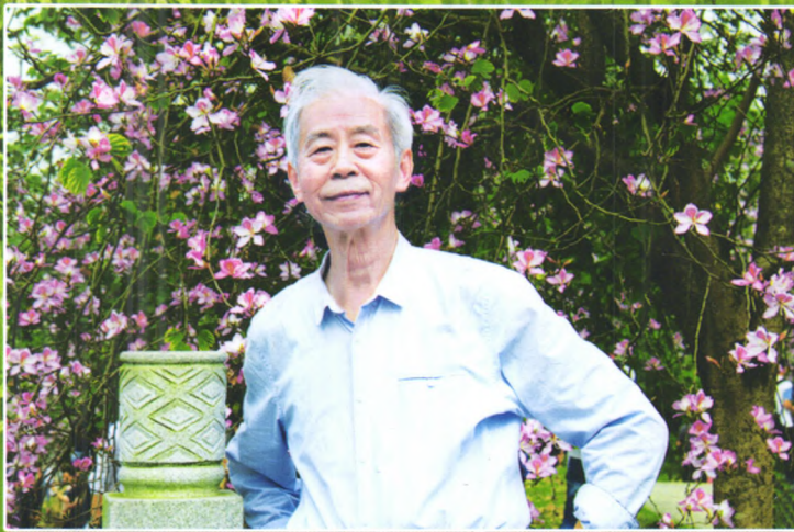
著名农史学家、华南农业大学周肇基教授