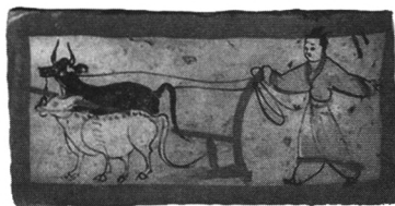
嘉峪关魏晋墓壁画犁田图