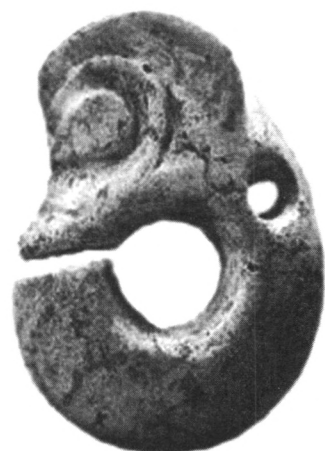
红山文化遗址出土的中国最早的玉龙