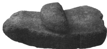
红山文化遗址出土的石磨