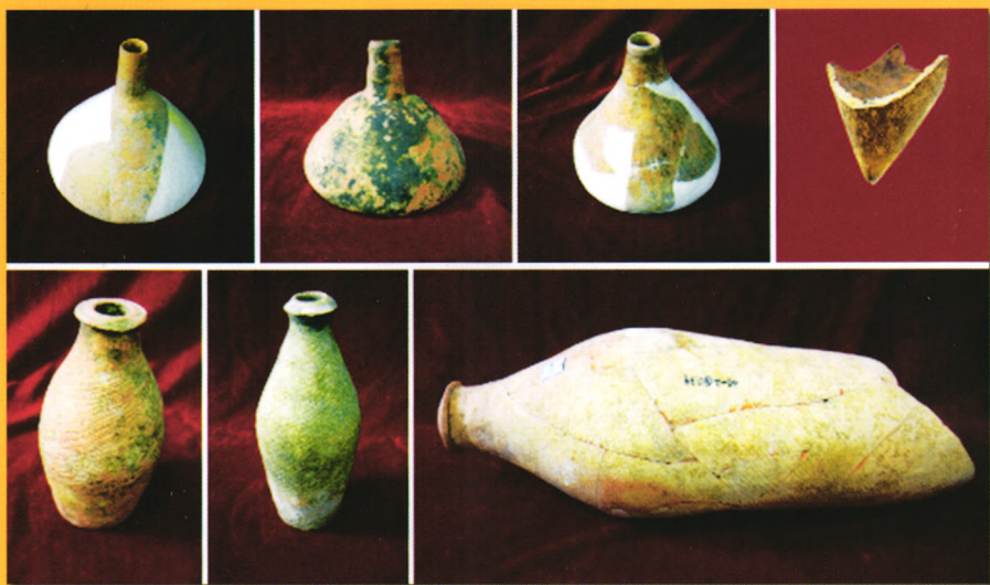
“2008年全国十大考古新发现”之首杨官寨遗址出土的仰韶文化时期的陶器