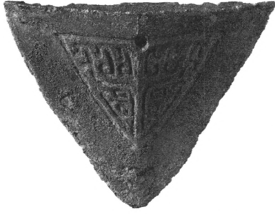
新干大洋洲商墓出土的青铜犁铤