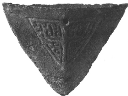
新干大洋洲商墓出土的青铜犁铧