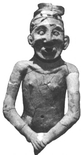
红山文化遗址出土的中国最早陶人