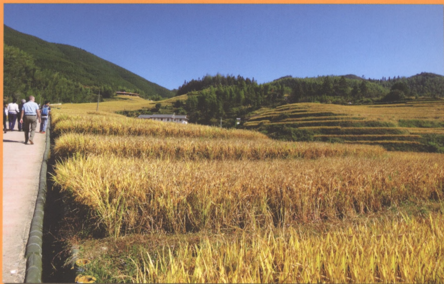
世界农业文化遗产——江西崇义县上堡客家梯田