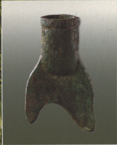
江西新干县大洋洲出土的商代青铜束