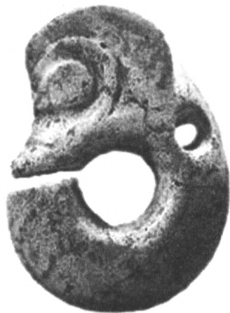
红山文化遗址出土的中国最早的玉龙