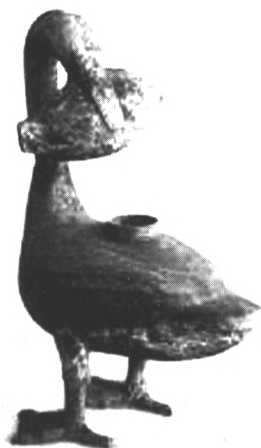
汉海昏侯墓出土的青铜雁鱼灯