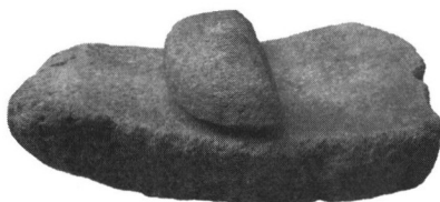
红山文化遗址出土的石磨