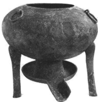
汉海昏侯墓出土的青铜温鼎