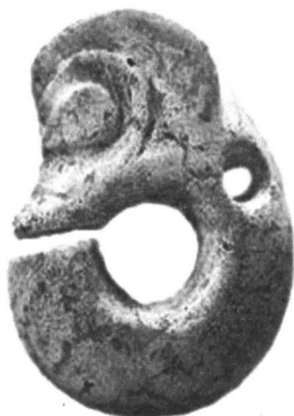
红山文化遗址出土的中国最早的玉龙