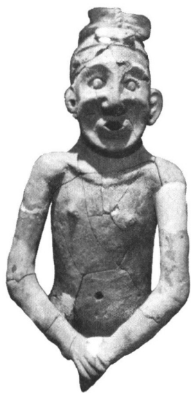
红山文化遗址出土的中国最早陶人