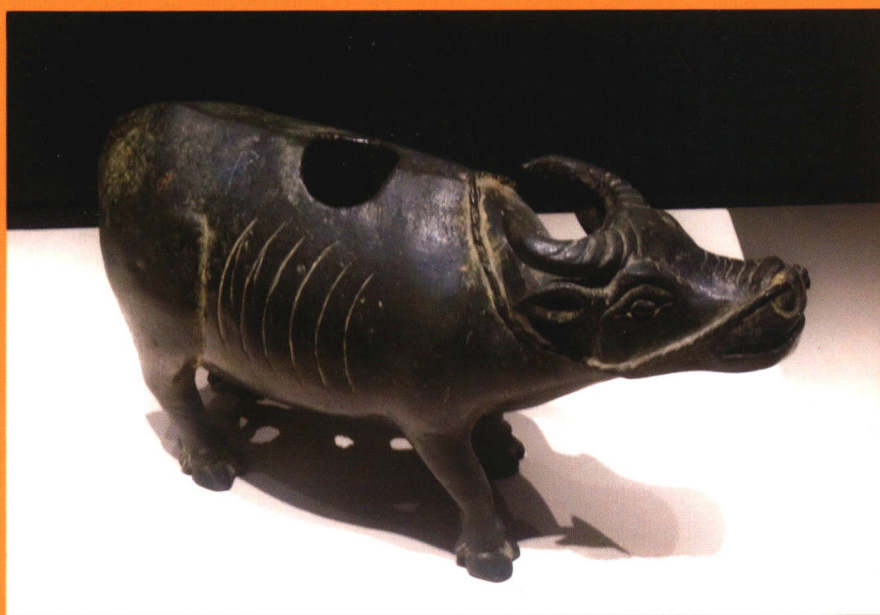
江西省博物馆藏明代立牛铜熏炉