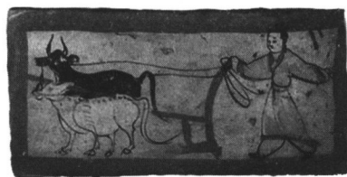
嘉峪关魏晋墓壁画犁田图