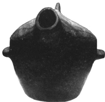
田螺山遗址出土的龟形陶甗