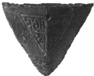
新干大洋洲商墓出土的青铜犁铧