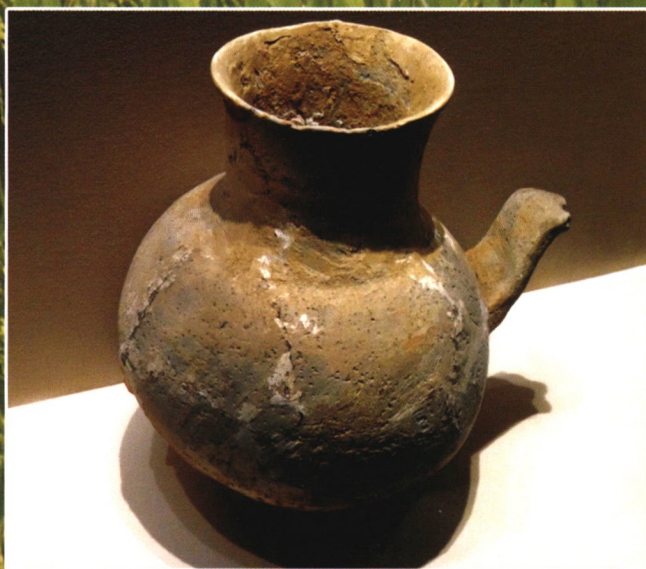
江西靖安县郑家坳墓葬出土新石器时代带柄陶壶