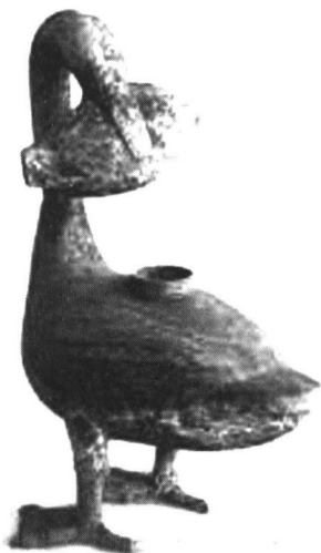
汉海昏侯墓出土的青铜雁鱼灯