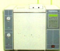
A3系列原子吸收分光光度计 PF6系列原子荧光光度计