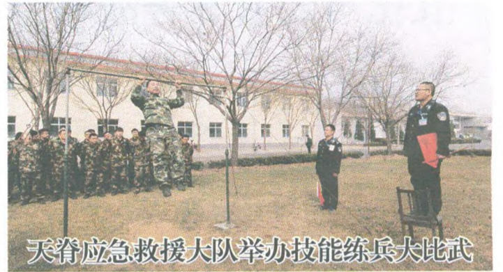
天脊应急救援大队举办技能练兵大比武

下一步,中农在线会在全省各会员农资“4S店”所在地区大规模推广该系统,也将继续深化和浙江省农行的合作,共同探索农资供应链金融等领域的创新做法。(郭靖)