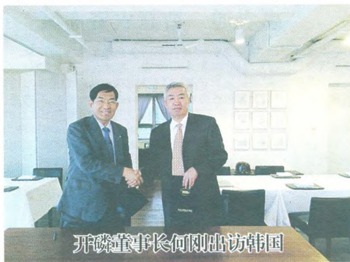
开磷董事长何刚出访韩国

据了解, 宜化集团是目前中国最大的化肥企业之一, 年产各类肥料1000余万吨。云农股份公司是云南省百强企业, 是云南省最大的农资流通龙头企业, 拥有7条铁路专用线, 仓储总面积达20万平方米, 经营网点遍布云南省各地, 是国家化肥商业淡储计划任务主要承储企业, 省政府唯一指定的全省边贫救灾化肥承储企业, 是云南省首家拥有化肥自营进出口权的企业, 业务辐射南亚、东南亚和拉美等国家。