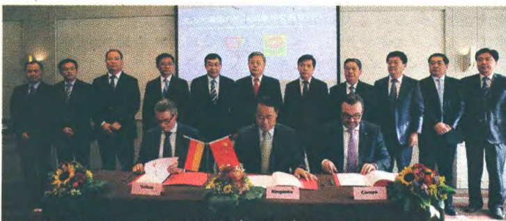
山东省副省长、省长郭树清(后排中)等领导见证三方交割签约。

释肥生产商,亚洲最大的硝基肥和水溶肥生产商,也是中国最大的新型肥料企业。而并购对象康朴公司更是60年欧洲老品牌,欧洲公认的最高端园艺类肥料、植保产品供应商,市场占有率位居欧洲第一,旗下拥有600名全球化团队,产品辐射全球100多个国家,蜚声全球肥料界。