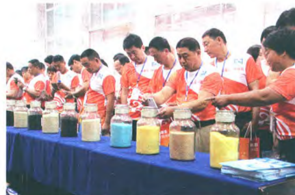
▲ 与会人员参观祥云健康系列产品。

与会人员还共同观看了祥云健康肥料招商片、推介片和广告片,参观了祥云健康系列产品,引起了大家的共鸣。在下午举行的订货环节,场面十分火爆,仅仅一个多小时就完成订货量15万吨,订货价值3亿元。