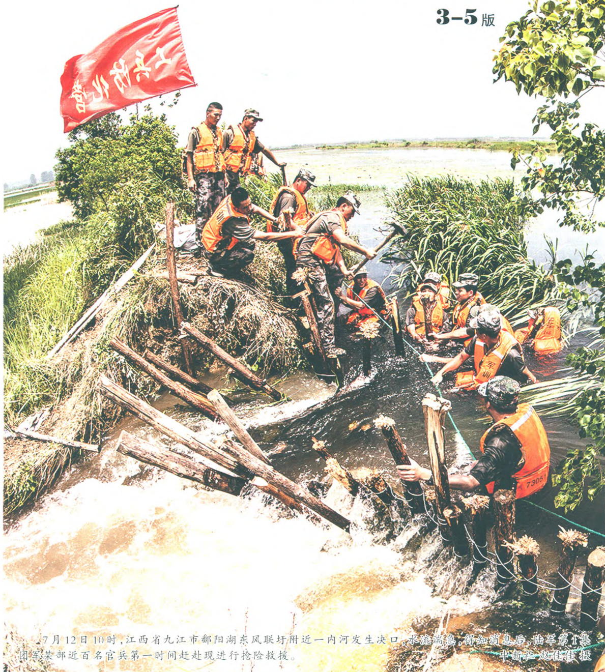
7月12日10时,江西省九江市鄱阳湖东风联圩附近一内河发生决口,水流湍急,得知消息后,陆军第1集团军某部近百名官兵第一时间赶赴现场进行抢险救援。