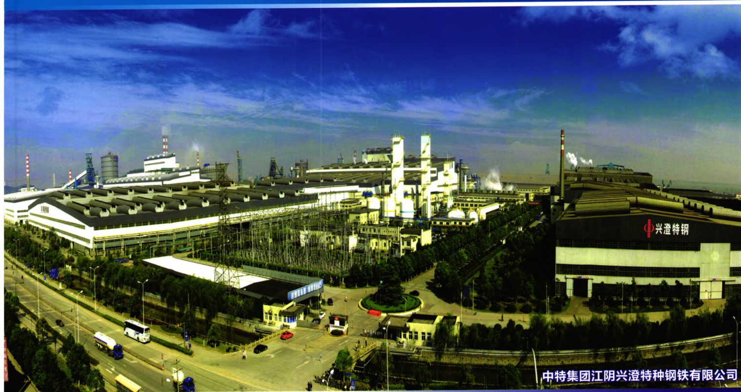
中特集团江阴兴澄特种钢铁有限公司

中信泰富特钢集团(简称中特集团)生产的轴承钢、齿轮钢、易切削非调质钢、合金结构钢、弹簧钢等产品,纯净度高、成分均匀、性能稳定,广泛用于制造汽车发动机、变速箱及传动系统等零部件。产品供货于一汽、东风、上汽、重汽、德国大众、美国通用、日本丰田、本田、日产、德国ZF、美国EATON、陕西法士特等国内外著名汽车集团及汽车零部件制造商。