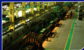
合金钢棒材生产线