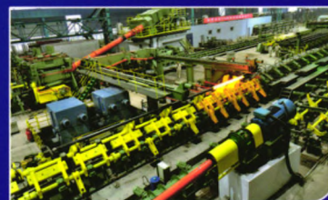
特种无缝钢管生产线