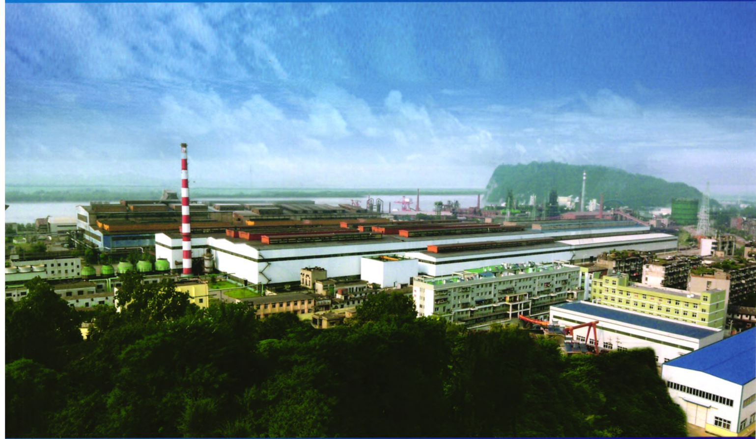
中特集团湖北新冶钢有限公司

中信泰富特钢集团（简称中特集团）生产的轴承钢、齿轮钢、易切削非调质钢、合金结构钢、弹簧钢等产品，纯净度高、成分均匀、性能稳定，广泛用于制造汽车发动机、变速箱及传动系统等零部件。产品供货于一汽、东风、上汽、重汽、德国大众、美国通用、日本丰田、本田、日产、德国ZF、美国EATON、陕西法士特等国内外著名汽车集团及汽车零部件制造商。