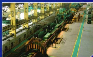
合金钢棒材生产线