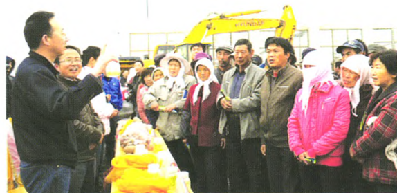
马铃薯“青薯9号”播种前技术培训现场