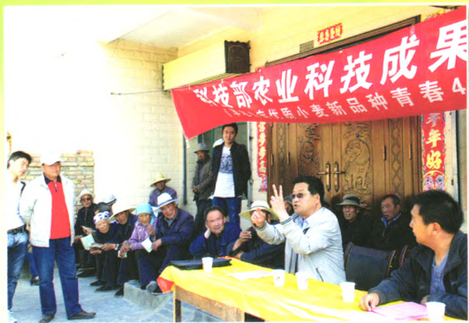
旱地抗病优质春小麦新品种“青春41”技术培训现场