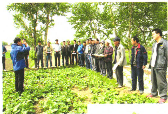
杂交油菜制种 技术现场