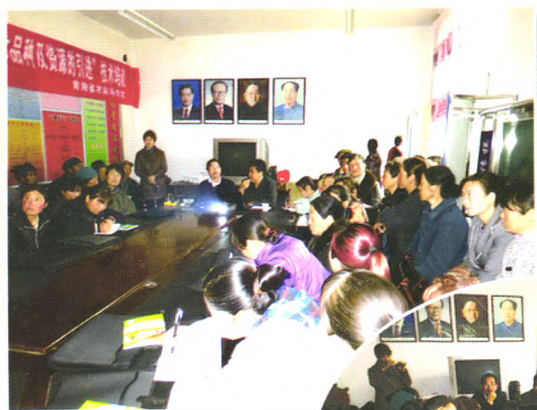
乐都长辣椒嫁接 技术培训现场