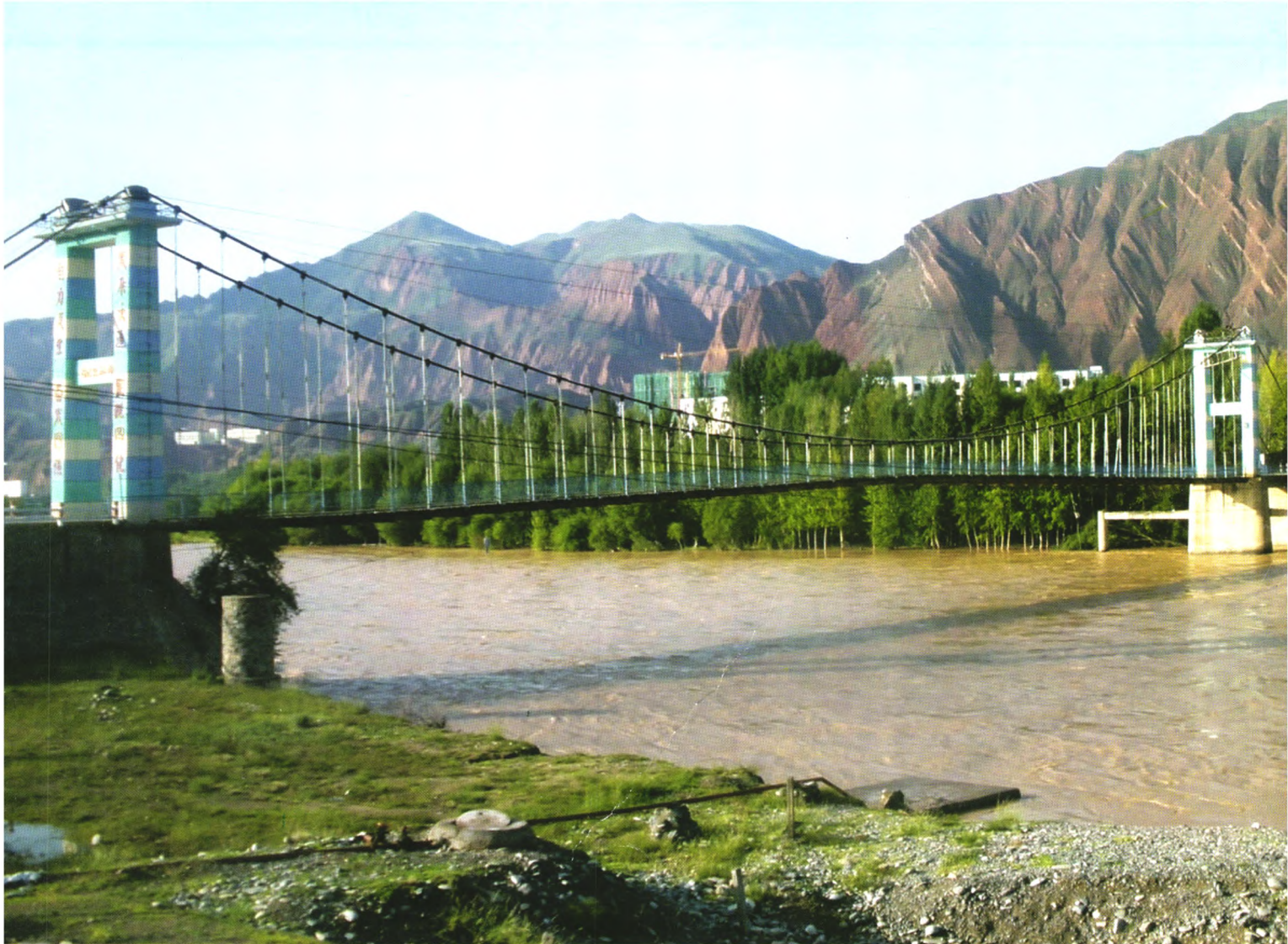
黄河积石吊桥(循化)