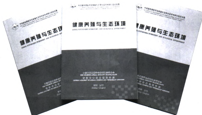
青海省牧科院科研管理处供稿

今年8月,会议主办单位向我院图书资料室赠送《健康养殖与生态环境——中国畜牧兽医学学会家畜生态学会学术研讨会论文集》4册,丰富了院图书资料室馆藏文献种类,是农牧类专业文献部门重点收藏的综合性图书,欢迎科技人员、研究生阅读学习。