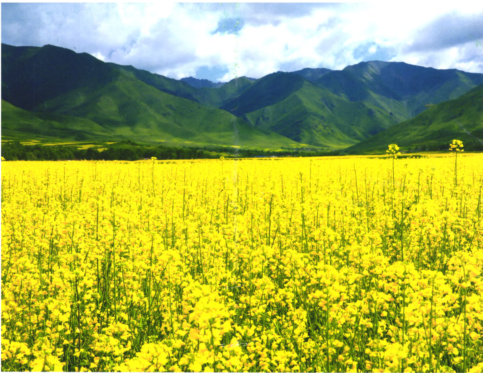
互助县南门峡油菜花