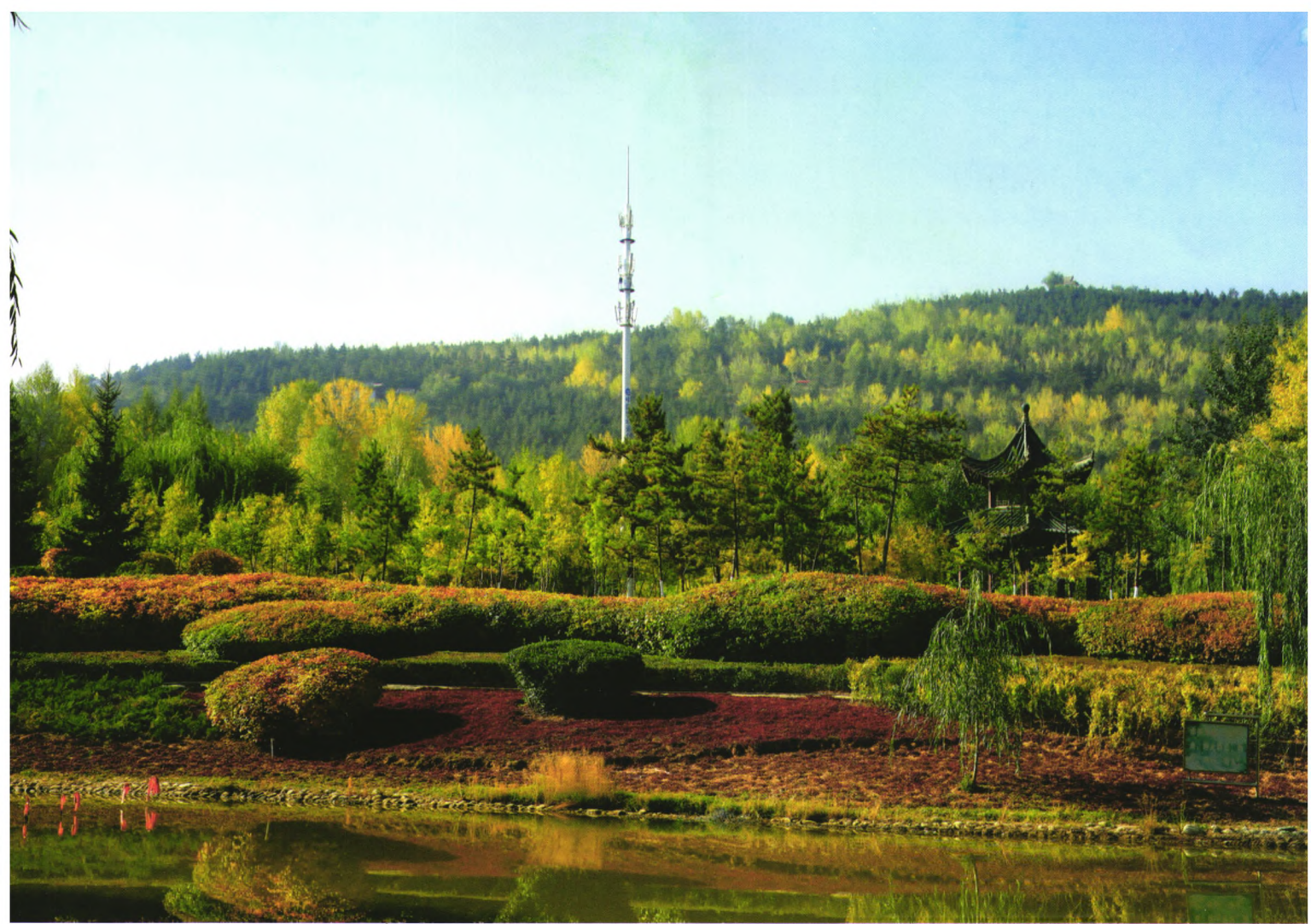
西宁南滩河畔风光