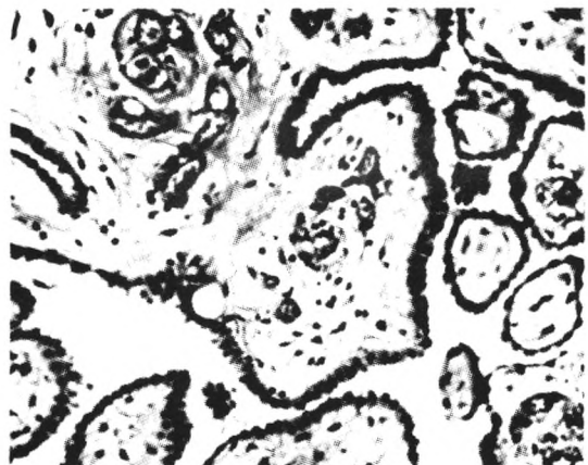
图2 乳头表面覆以单层立方上皮，细胞呈圆形或卵圆形，位于细胞中央，异型性不明显。HE 中倍放大。

该肿瘤发生于胸膜、腹膜，更多发生于腹膜，男女均可发生，主要发生在女性。已报道的年龄分布为(31~79)岁，中位年龄为63岁。发生于腹腔的部分患者常无临床症状而在手术时意外被发现。报道有些病例有石棉接触史，但未被流行病学研究所证实 [3] 。进一步研究发现，它是一个进展性的病变，应当将其视为恶性肿瘤 [4] 。本例患者，65岁，无石棉接触史，于术中意外发现，低倍镜下见肿瘤形成复杂的乳头状结构，乳头具有黏液样变或疏松纤维结缔组织轴心，表面被覆单层立方上皮，细胞异型性不甚明显，与文献报道相符合。