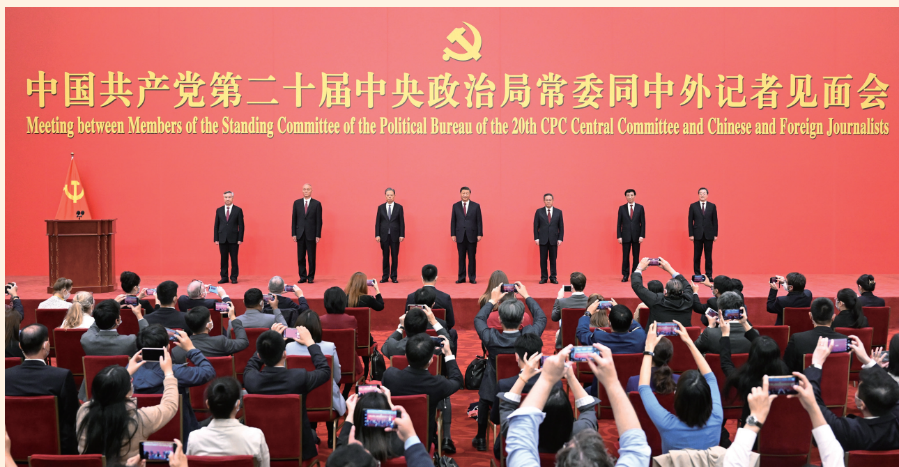
10月23日，刚刚在中国共产党第二十届中央委员会第一次全体会议上当选的中共中央总书记习近平和中共中央政治局常委李强、赵乐际、王沪宁、蔡奇、丁薛祥、李希在北京人民大会堂同采访中共二十大的中外记者亲切见面。