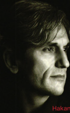
Hakan Saracoglu 奇瑞汽车设计总监 原保时捷Cayman设计师