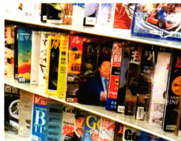
首都机场T3实景拍摄