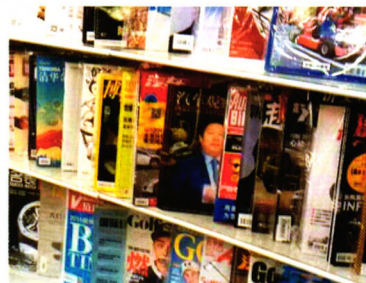
首都机场T3实景拍摄