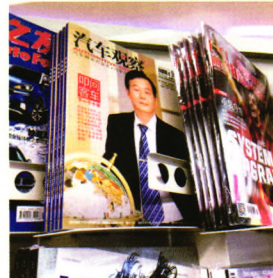
首都机场T3实景拍摄