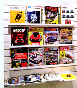
首都机场T3实拍拍摄