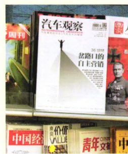
首都机场T3实拍拍摄